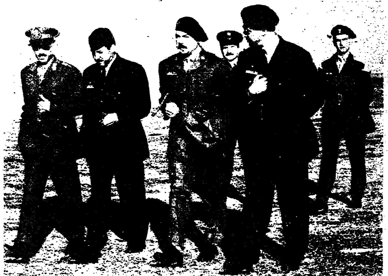
عدد من أعضاء مجلس قيادة الثورة: عبد الحكيم عامر، عبد اللطيف البغدادي، حسين الشاذلي

نعم ما بنينا .. كما ان اسحقنا سيمطي تجيب السلاح الذي سيقضي به علينا وعلى اعدائنا .. ولا كان موعده انتقاد المؤتمر المشترك بين الوزراء واعضاء مجلس قيادة الثورة قد آتت .. ولابد من تواجد محمد نجيب في هذا الاجتماع معنا .. نعمنا لاقتضار خبر استقالته وايقاف السلطات التي انتشرت .. كان علينا ان نتولى اقتناعه بسحب استقالته واولا بدينيا .. فلقد كان المجلس جمال سالم وحسين الشاذلي لاقناعه بسحبها .. بعد فترة اتصل بنا جمال سالم ليقولنا ليلفتنا بان نجيب معه في قلعة الموتر .. فخرجنا جميعا اليه ماعدا جمال عبد الناصر الذي اتفقا معه على ان نكمل مناقشة الموضوع في منزله بعد الانتهاء من المؤتمر ..